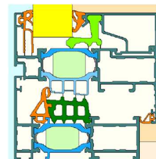
Isoleringskiler som tilvalg