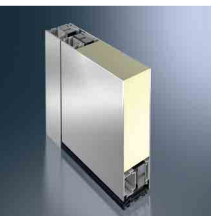
Schüco Türsystem ADS 75.SI Schüco door system ADS 75.SI