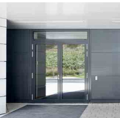
Schüco Aluminium-Türsystem ADS 75.SI Schüco Aluminium door system ADS 75.SI

Aluminium-Türsystem Aluminium Door System