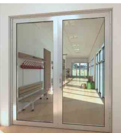
Klemmfreie Tür Anti-finger-trap door

The series is based on stable, 5-chamber hollow profiles with a basic depth of 80 mm with which clear opening dimensions of up to 1400 mm x 2988 mm can be constructed. Optional fittings components can be added to create tailored, multi-purpose doors to meet the widest range of requirements for building security and automation. In addition to fire and smoke protection properties, this series features other application options. These include, for example, burglar resistance to RC 3 (WK3), a combination of burglar resistance to RC 2 (WK2) and a panic function, sound reduction (42 dB) and the safety barrier with building authority approval for fixed glazing. Mechanical durability test certificates in accordance with EN 12400, class 8, are also available. It was possible to obtain the certificate for doors with 1 million cycles using this stable system. Furthermore, tests for protection against vandalism in accordance with EN 1192, class 4, were also passed. Class 4 is the highest protection against vandalism and excessive use of force. The use of central glazing or angled glazing beads provides the user with numerous design options. Concealed top door closers, pre-selectors or door hinges can also be used. Features of the fixed glazing include floor-to-ceiling height and a design with vertical silicone joints. Another option is the use of an opposed opening door. Whether in a newbuild or a renovation project, these opening types ensure smooth functioning for day-to-day operation.