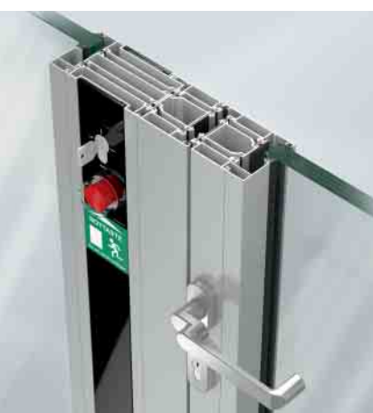
Schüco Door Control System (DCS) Schüco Door Control System (DCS)