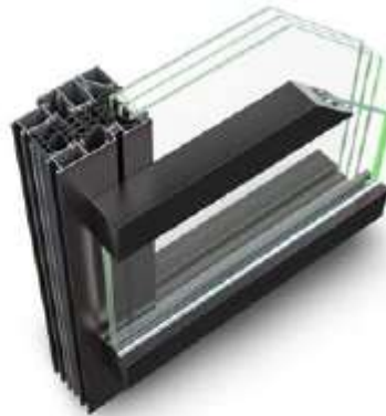
Horizontale Befestigung als Handlauf Horizontal mounting as handrail