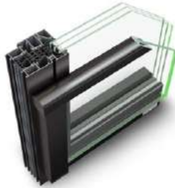
Vertikale Befestigung mit abgerundetem Handlauf (Optional vorbereitet für LED-Einbau) Vertical mounting with rounded handrail (optionally prepared for LED installation)